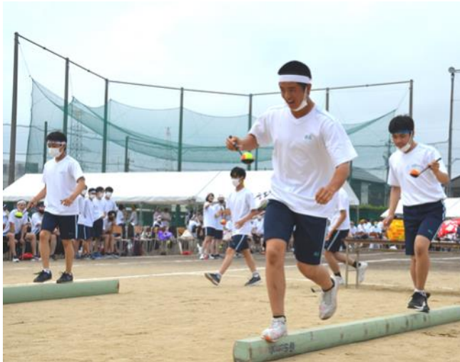
落としてたまるかっ!! ディスタンス競争

体育大会は「コロナに負けるな！夏空の下のディスタンス競争」で午前の部が終了。80m走、「無限8」など、国際生達は懸命に競技に取り組み、白熱した戦いを展開している。