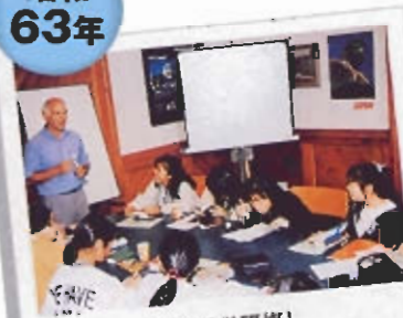
初の語学研修! ニュージーランドの姉妹校にて。