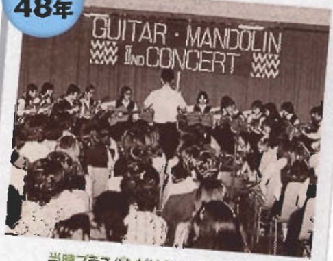
当時ブラスバンドはなかったけど、ギター・マンドリン部が大活躍~!