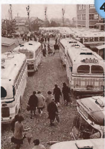
出願者数が増えたと噂されて、受験前には無料バスが埋めつくしたんだよ。