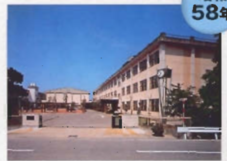
校舎もお庭もきれいになったね。みんな心機一転!