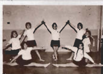
演技もすごいけど、体服も……