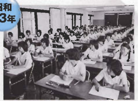
大教室でお勉強。まなざしが真剣そのもの。進学率の高さも納得。