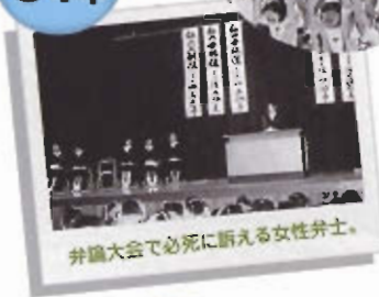
弁論大会で必死に斬る女性弁士。