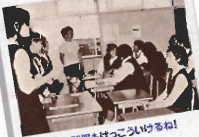
昔の制服もけっこういけるね!