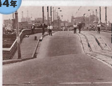
神通大橋が落ちた年。生徒は神通川を泳いで登校した?