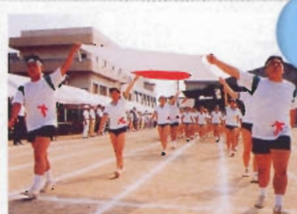
共学になって、さらにパワーアップした国際高!